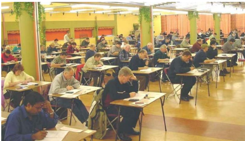
enkele aspirant radiozendamateurs bezig met het examen.

Opleidingen voor het examen worden over het algemeen verzorgd door afdelingen van verenigingen, waar ervaren radiozendamateurs hun expertise inzetten en vrije tijd opofferen om enthousiaste aspirant radiozendamateurs op te leiden tot bevoegde radiozendamateurs.