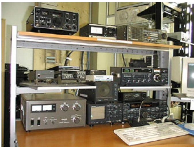
"shack" van een willekeurige radiozendamateur

Je leest deze brochure omdat je een geïnteresseerd persoon bent, die belangstelling heeft voor buitengewone dingen. Of je vindt het leuk om met andere mensen te praten, of je wilt iets meer weten over techniek en met name elektronica. Onze wereld zit tenslotte vol met elektronische hulpmiddelen. Als een radiostation - voor niet-commerciële doeleinden - gebruikt wordt om verbinding te maken met radiohobbyisten, noemen wij dat radioamateurisme. Dit wordt ook wel HAM Radio genoemd. Zelf noemen we ons "radiozendamateurs" of "ham operators".